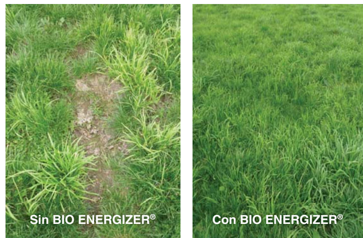
Regadío Hierbas Phalaris

Las fotos muestran la diferencia en la calidad y espesor de la dehesa, y el gráfico muestra el aumento de los cinco (5) primer valores de los nutrientes del agua tratada con BIO ENERGIZER®.